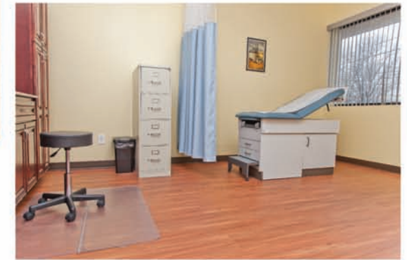
Nuestra sala de examen le permite visitas y evaluaciones médicas en nuestra instalación