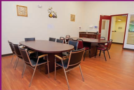
Nuestras salas sociales son excelentes lugares para juegos, eventos y entretenimiento.

Los participantes pasan su día con nosotros disfrutando de actividades divertidas y socializando con los demás. Cada huésped es tratado por nuestros proveedores y expertos con el máximo respeto y cordialidad.