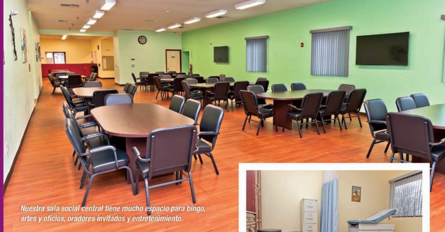
Nuestra sala social central tiene mucho espacio para bingo, artes y oficios, oradores invitados y entretenimiento.